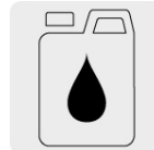
Aceite monogrado SAE30